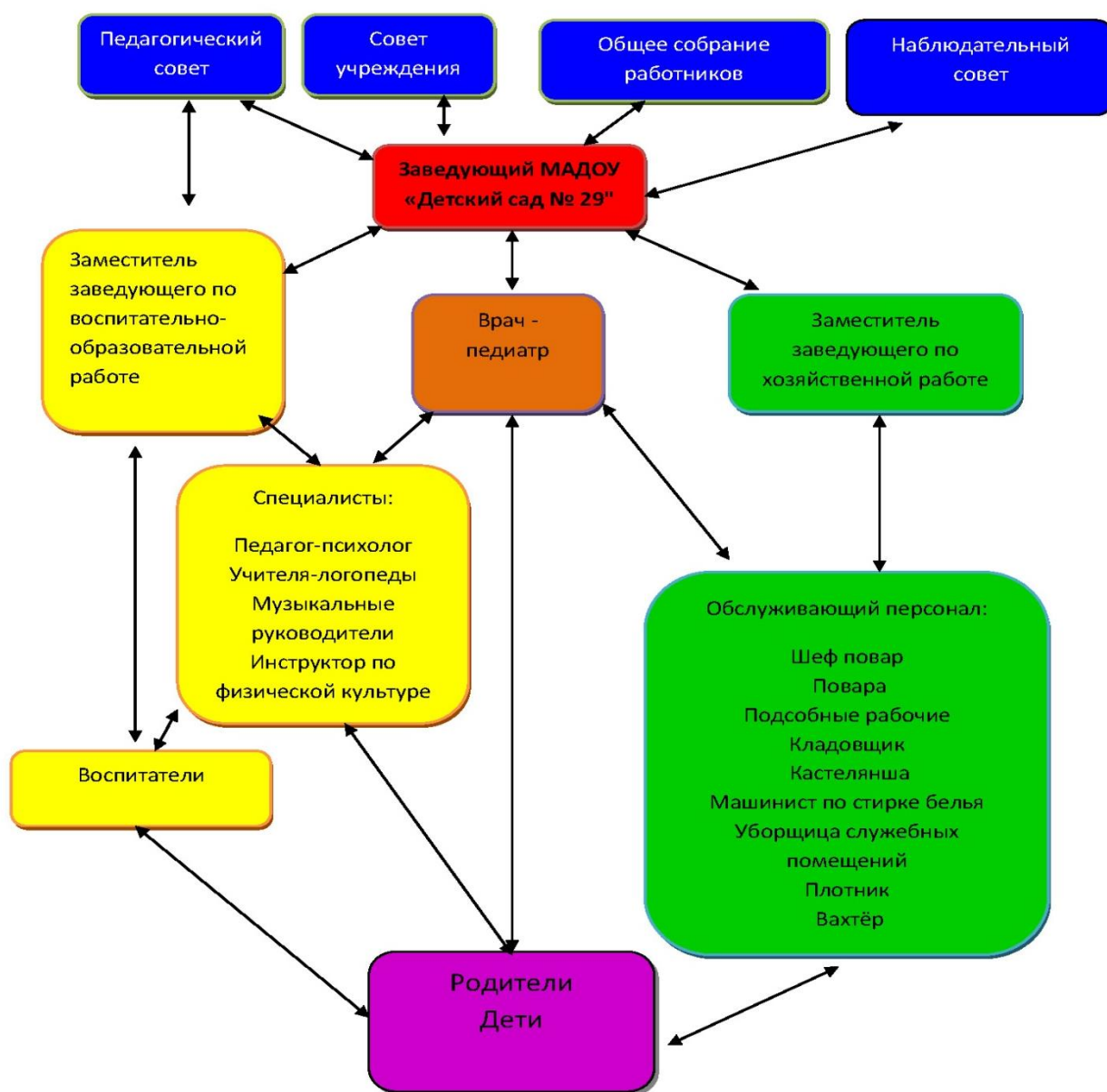
СХЕМА УПРАВЛЕНИЯ МАДОУ «Детский сад № 29»

Реализуя функцию планирования, администрация детского сада непрерывно устанавливает и конкретизирует цели самой организации и структурных подразделений, определяет средства их достижения, сроки, последовательность их реализации, распределяет ресурсы.